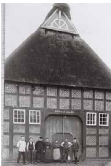
Der Lahrshof um 1911

dem Lahrshof nebenan findet eine Historischer Handwerker-Markt statt - beides mit vielen Mitmach-Aktionen für Jung und Alt. Zum Kaffee geht's am Nachmittag in den Pfarrgarten. Der Montag steht im Zeichen der Generationen. Jung und Alt kommen zusammen: Senioren besuchen Schüler und