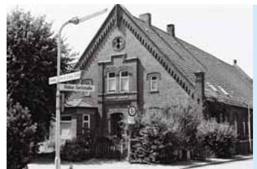
Klattehof an der Ahlker Dorfstr. im Jahre 1983