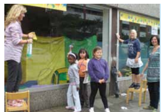
Die „Ladenzeile“ wird aufgepeppt

Wer heute nach Arsten-Nord in die Martin-Buber-Straße einfährt, sieht zur linken Seite eine Ladenzeile, in deren Mitte mehrere Schaufenster mit Kindermöbeln, Spielzeug und liebevoll von Kindern hergestellten bunten Kunstwerken ausgestattet wurden. Auch weisen eine Tafel und Schulranzen darauf hin, dass für die größeren Kindergartenkinder nun bald eine aufregende neue Zeit in der Schule beginnt. Noch vor ein paar Wochen sah es hier ganz anders aus. Seit Jahren besteht das Begehren der Menschen, die in diesem Teil von Arsten leben, darin, dass die Ladenleerstände endlich mit Leben und geschäftigem Treiben gefüllt werden. Das konnte trotz vieler Bemühungen des Centermanagements bisher nicht gelingen. Es gibt nur wenige kleine Einzelhandelsgeschäfte, die der großen Konkurrenz der anderswo entstehenden großen Supermärkte standhalten können. An dieser Stelle einen Herzlichen Dank für das Entgegenkommen des Centermanager! Wir, das sind Anwohnerinnen und Anwohner sowie viele dort tätige Institutionen, freuen uns über den freundlicheren Eindruck im Einfallstor von Arsten-Nord, der sich durch die Umnutzung als Ausstellungsfläche ergeben hat. Gleichwohl hoffen alle, dass dies nur ein Auftakt für weitere positive Veränderungen sein wird, dem noch viele andere folgen werden.