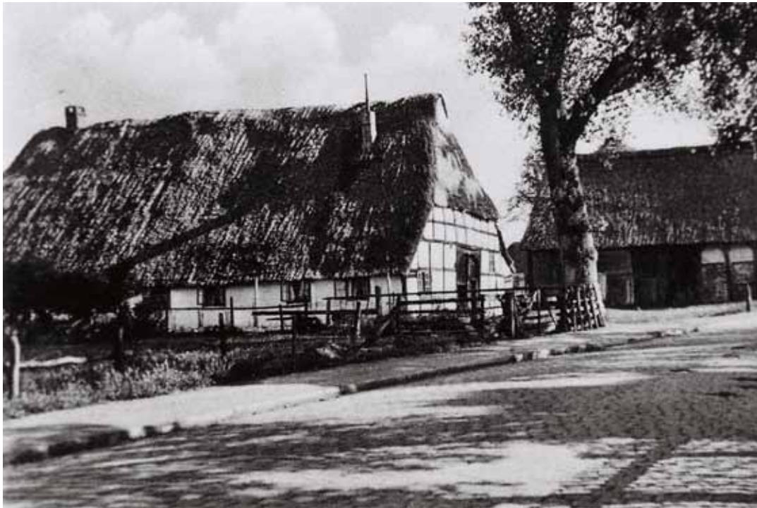
Der Beikenhof um 1930