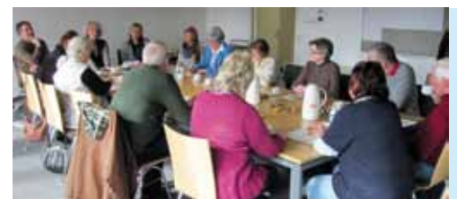
Erstes Treffen der Lesepaten in der Schule

Über die Suche in den Bremer Tageszeitungen hat das Forum Ältere Menschen für das neue Projekt „Lesepaten“ für Schülerinnen und Schüler der 5. Klassen des Neuen Gymnasium Obervieland dreizehn interessierte Senioren gefunden. Nach zwei Vorbereitungstreffen mit den Lesepaten und der Schulleitung stellen wir fest, dass wir weitere interessierte Senioren-Lesepaten einsetzen können.